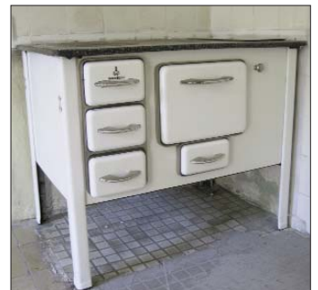
Die Küchenhexe hat erst im Oktober die Neuhauser Wohnung verlassen – das war gar nicht so einfach bei ihrem Gewicht von fast 200 Kilo!