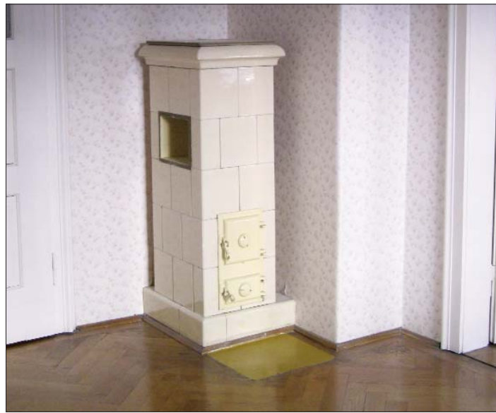
Der Kachelofen gehörte 1929 zur Erstausrüstung. Fest verankert ist er ein echter Zeitzeuge und bleibt der Neuhauser Wohnung auf immer verbunden. – Auch unter Denkmalschutz stehen die prächtigen Spione an den Wohnungstüren des Anwesens im Lehel (unten).

Der Dielenschrank oben stammt von 1929, demselben Jahr also, in dem das Wohnhaus an der Gudrunstraße errichtet wurde. Er ist denkmalgeschützt – ebenso wie der Küchenschrank unterm Fensterbrett (rechts). Kühl, dunkel und mit Luftlöchern in den Türen bietet er Stauraum, zum Beispiel für Lebensmittel.