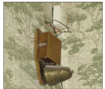
Die Türglocke war bis November in einer Wohnung an der Pötschnerstraße im Einsatz.