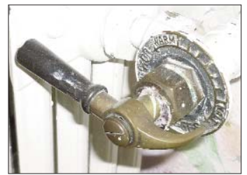
Der Heizungsregler stammt aus den 20er Jahren. Heute, im Zeitalter des Energiesparens, hat er längst ausgedient.